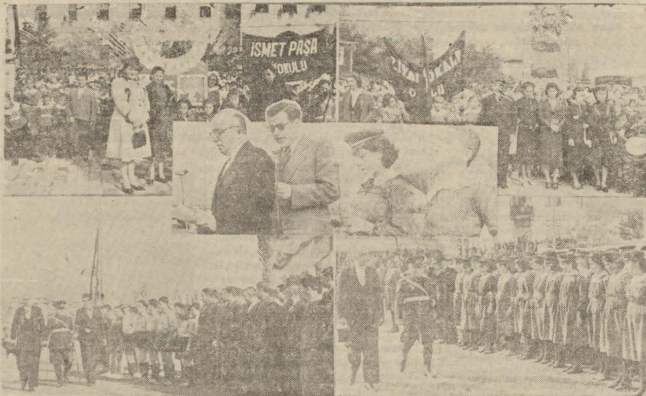
Cümhuriyet Bayramı bütün yurdda coşkun bir şekilde kutlanmıştır. Resim Sivas ve Çankırıdaki bayramdan intibalar. Ortada Çankırıda bayram günü birer nutuk söyleyen Valiyi ve bir gençle iki mektebliyi görüyorsunuz.