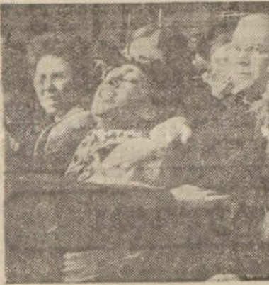
— Atam bizi bırakıp da nereye gidiyorsunuz?

17 Birinciteşrin Pazar günü neşredilen bir resmi tebliğ ile, millet Büyük Şefinin hastalığını ilk defa olarak «reame» öğrenmiş bulunuyordu. Bu tebliğde, Atatürkün duçar olduğu karaciğer hastalığı